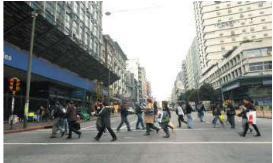
Los Patronatos asisten a los italianos y sus descendientes en Uruguay.

Guían al ciudadano en la correcta organización de la documentación para la presentación ante las autoridades consulares, ayudándoles a conseguir documentación de Italia y otros países; ayudan en la obtención y perfeccionamiento de la documentación; ayudan en todo lo inherente a actualización del estado civil, al uso de los portales informáticos utilizados para acceder a los servicios consulares como la obtención de turnos para el reconocimiento de la ciuda-