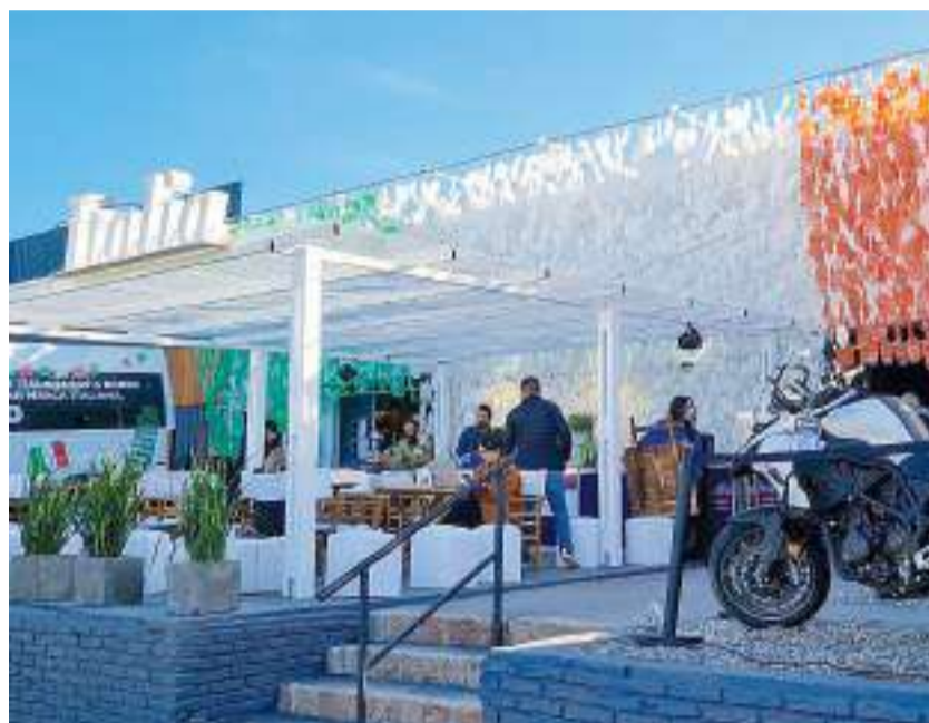
Fachada del Pabellón Italia en Expo Prado realizada con miles de botellas de plástico usadas recibió el premio de Innovación sustentable.

—Noviembre 2023. Participación de la CMUI al